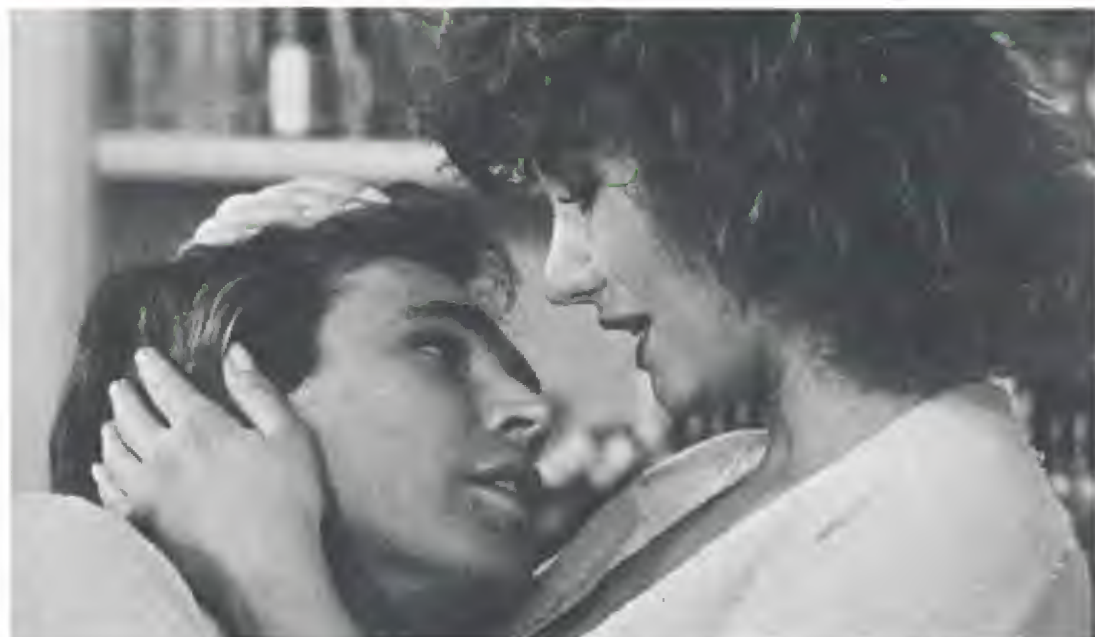
Juan Ribó - Victoria Vera